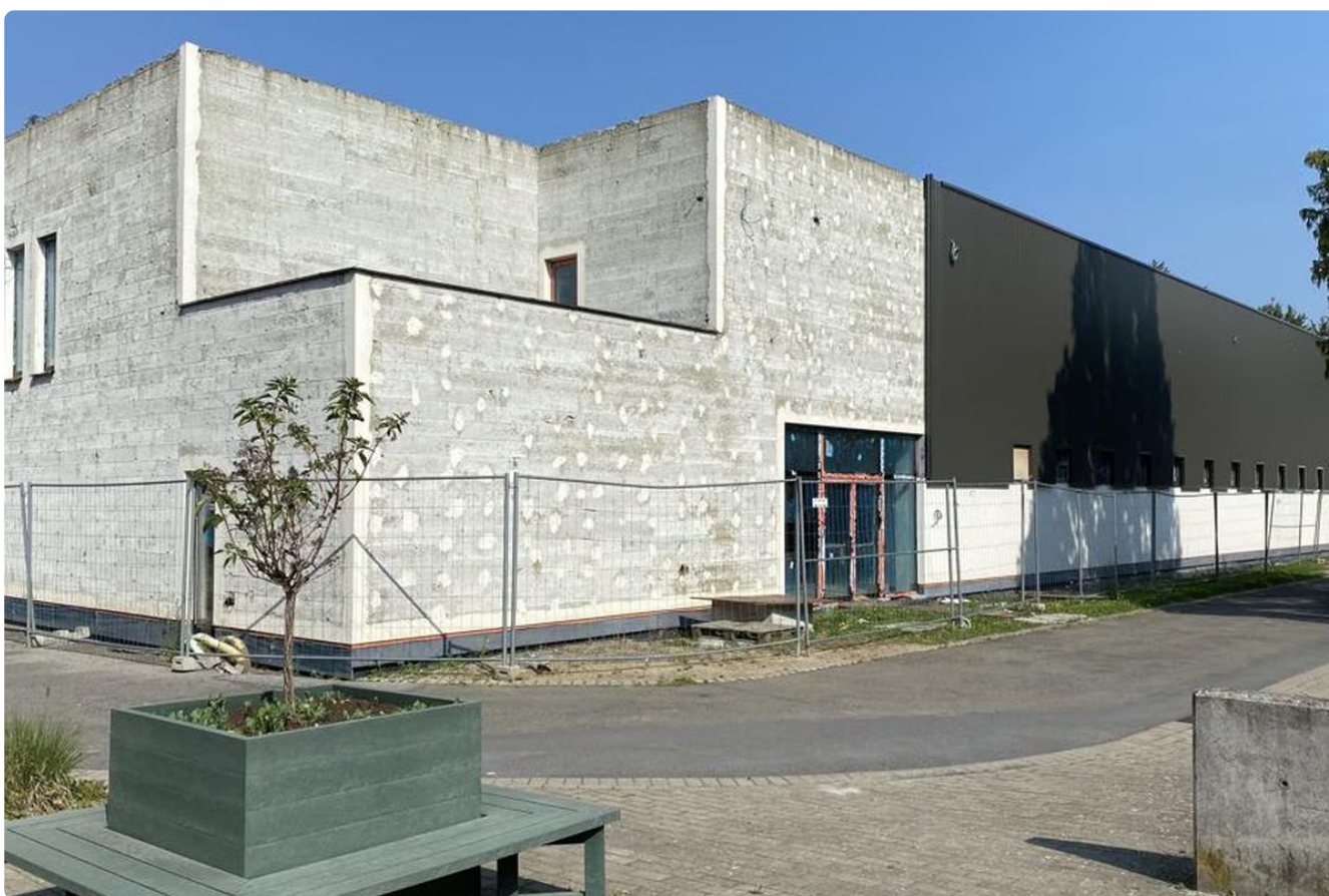
Les travaux devraient enfin reprendre pour le dojo fédéral à Louvain-la-Neuve.

À l'arrêt depuis décembre 2016, les travaux de construction du dojo fédéral, au complexe sportif du Blocry à Louvain-la-Neuve < https://www.lavenir.net/regions/brabantwallon/2017/03/14/louvain-la-neuve-les-travaux-du-dojo-federal-sont-a-larret-W3QFKSXIYNCWTEP4O3WGG7OKO4/ >, pourraient bientôt reprendre. En effet, après des mois de tractations et de combats judiciaires < https://www.lavenir.net/regions/brabantwallon/ottignies-louvain-la-neuve/2022/03/24/le-projet-de-dojo-federal-a-louvain-la-neuve-va-redemarrer-4YWBOWM4LFBDHGSLW6IO3CM7SI/ >, la Fédération francophone belge de judo a annoncé que le projet était de nouveau sur les rails.